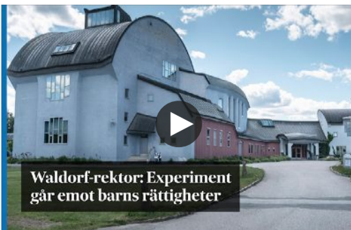
Waldorf-rektorn: Experiment går emot barns rättigheter

Waldorf-rektorn om "De utvalda barnen". SvD.se/GaoVa9